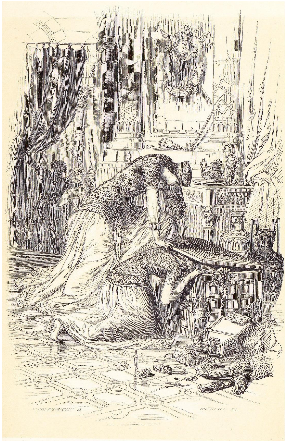
Frédégonde étouffant sa fille.